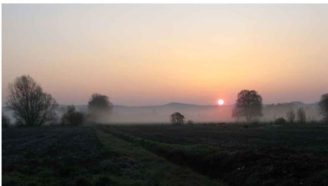
Ljubljansko barje, (Slovinsko).

REDAKCE Jörn Freyer Burkhardt Kolbmüller