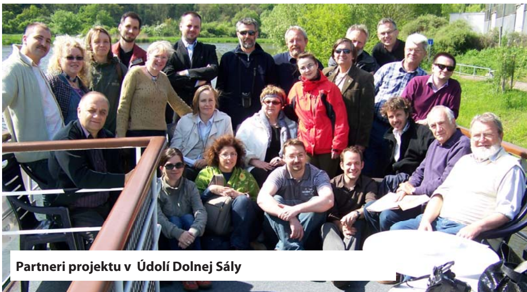
Partneri projektu v Údolí Dolnej Sály