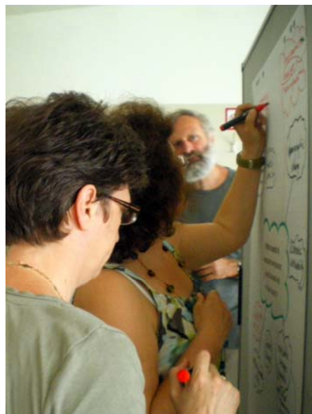
Brainstorming o tom, ako hodnotiť už realizované projekty.

Pracovný balíček 3 zahŕňa vývoj a/alebo prispôsobenie inovačných metód pre vizualizáciu a umiernenie vplyvu zmien krajiny (napríklad databáza GIS, 3D animácia, participatívna moderácia podľa Agendy 21). Dňa 1. júla 2010 sa zišla pracovná skupina, zložená zo zástupcov všetkých ôsmich partnerských inštitúcií, aby posúdila existujúce prístupy a jednala o ich budúcej realizácii. Hlavným aspektom bolo vytvorenie spoločných definícií kľúčových pojmov a vypracovanie kritérií pre hodnotenie úspechu či neúspechu už realizovaných projektov a procesov v krajine a regionálnom rozvoji. Resumé a protokol je k dispozícii on-line na webovej stránke www.vital-landscapes.eu .