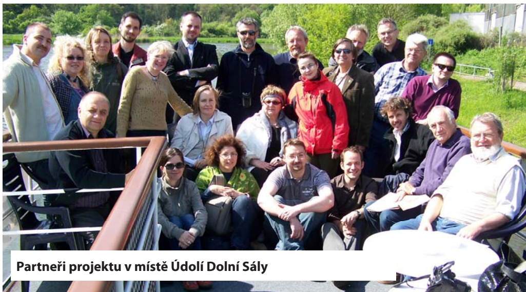
Partneři projektu v místě Údolí Dolní Sály