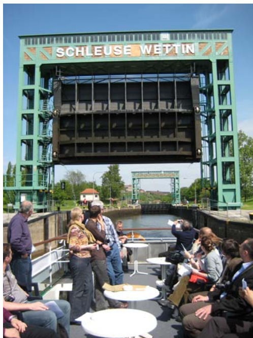
Partneři projektu prozkoumávali pilotní region Údolí Dolní Sály lodí.

Úvodní konference, která se konala 20.–21. května 2010 v Magdeburgu v Německu, oficiálně zahájila projekt VITAL LANDSCAPES. Partnerské instituce představily své společné cíle a plánovaná opatření zhruba sedmdesáti hostům z Německa i ze zahraničí. Program a prezentace lze stáhnout na webových stránkách projektu: www.vital-landscapes.eu .