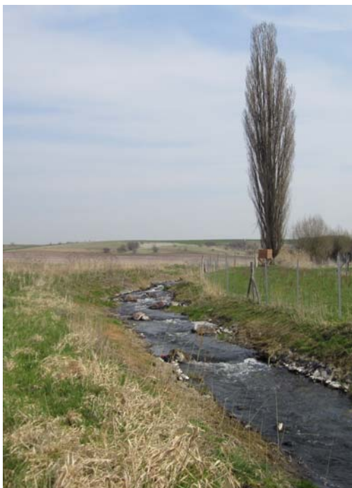
Realizovaný projekt Ecopool: Řeka Aller nedaleko Wefenslebenu, Sasko-Anhaltsko, před a po přesměrování do svého přirozeného říčního koryta (2008/2010)