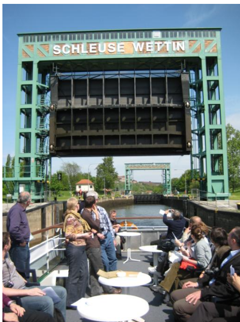
Projektni partnerji z ladjico raziskujejo pilotno regijo - dolino spodnje Saale

PRVO SREČANJE IN EKSURZIJA PO NEMŠKI ZVEZNI DRŽAVI SAŠKA-ANHALT