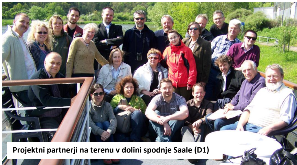
Projektni partnerji na terenu v dolini spodnje Saale (D1)