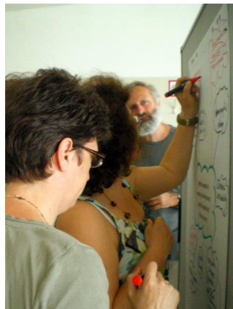
Delavnica na temo: kako ocenjevati že izvedene projekte

Delovni paket 3 se ukvarja z razvojem in prilagoditvijo inovativnih metod za vizualizacijo in moderacijo (kot so na primer podatkovne baze GIS, 3D animacije, participativna moderacija uporabljena pri Agendi 21 idr) posledic sprememb v krajini. 1. julija 2010 se je sestala delovna skupina, sestavljena iz predstavnikov vseh osmih partnerskih ustanov in preučila obstoječe pristope ter razpravljala o možnih načinih izvajanja. Cilj srečanja je bil poenotenje definicij ključnih pojmov ter določitev meril za ocenjevanje uspešnosti že izvedenih projektov in procesov na temo krajine in regionalnega razvoja. Povzetek in zapisnik si lahko ogledate na spletni strani www.vital-landscapes.eu .