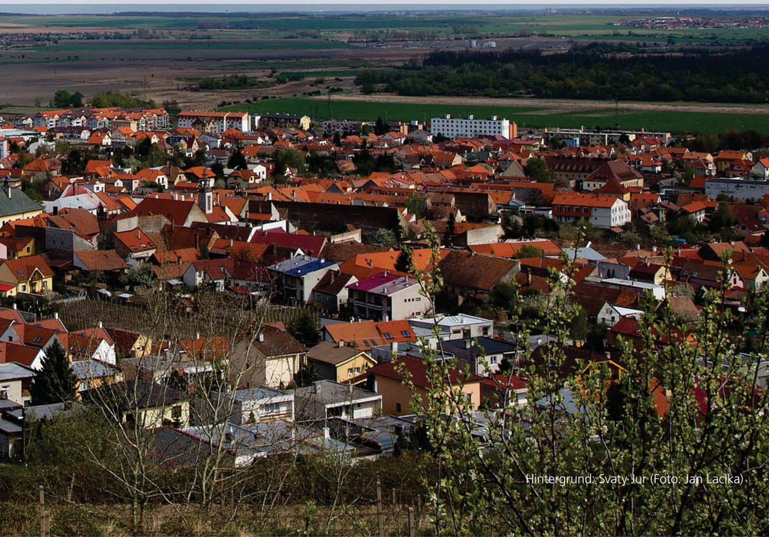
Hintergrund: Svätý Jur