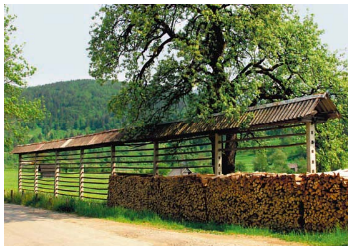
Historické krajinné prvky v Národnom parku Triglav (Slovinsko).