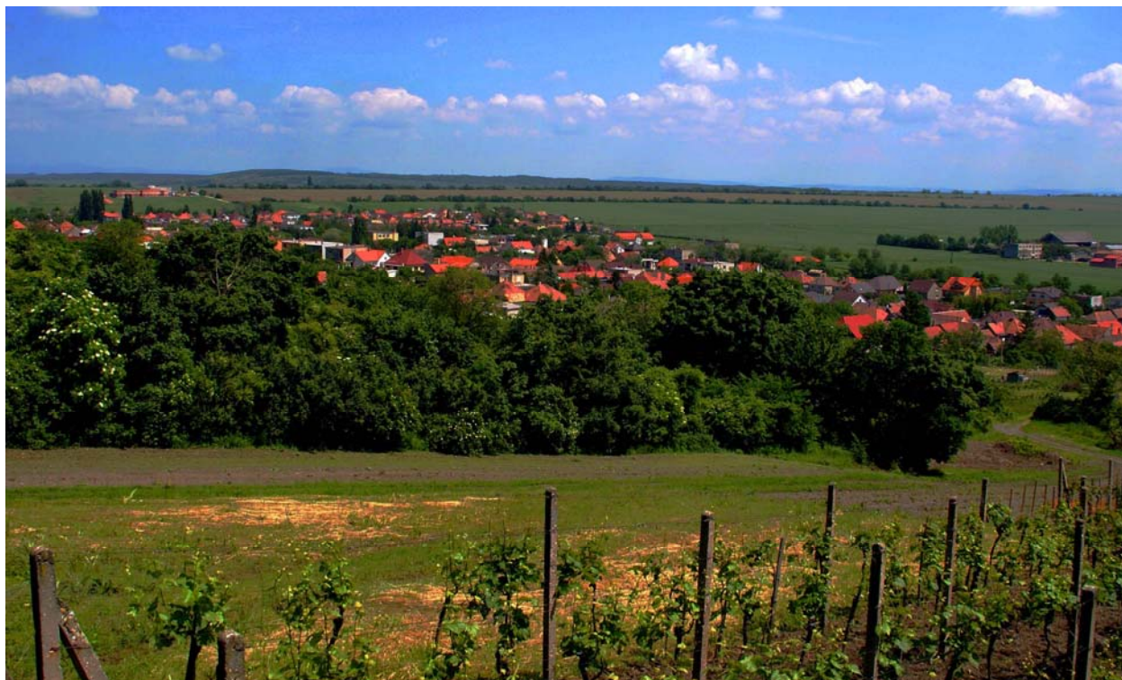
Horné Orešany, Podmalokarpatský región (Slovensko) z juhu.